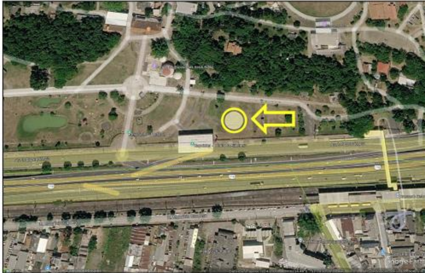
Imagem de localização (Google)