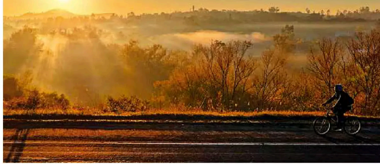
Chegada de massa de ar polar fez temperatura despencar em Livramento e gerou lindas imagens

Mais da metade de maio teve marcas abaixo de zero