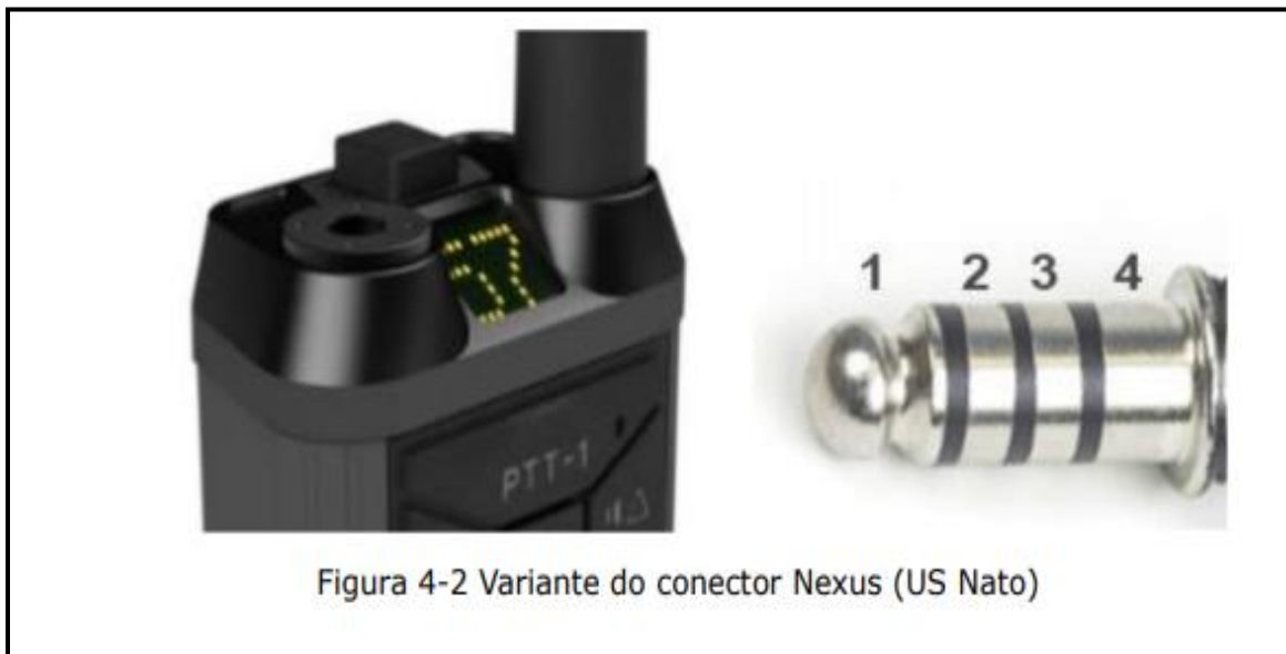
Figura 4-2 Variante do conector Nexus (US Nato)