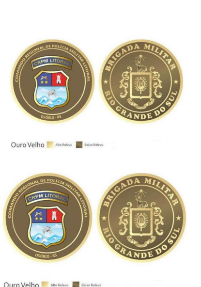
ANEXO A - IMAGEM ILUSTRATIVA MOEDA