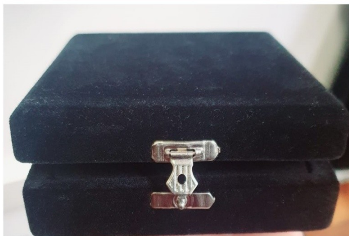
IMAGEM ANEXO B