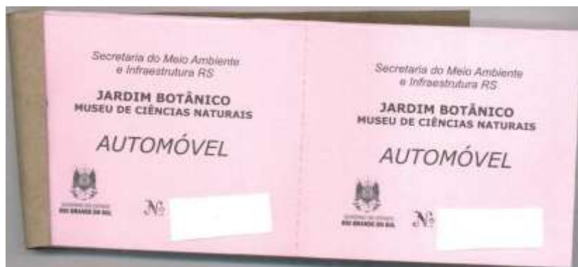
BLOCO INGRESSO AUTOMÓVEL COR ROSA