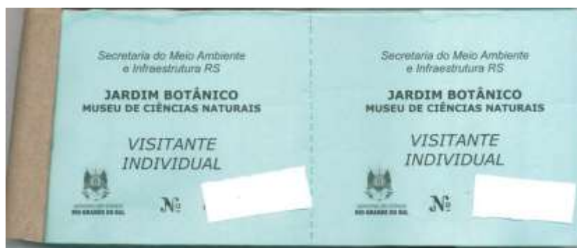
BLOCO INGRESSO INTEIRO