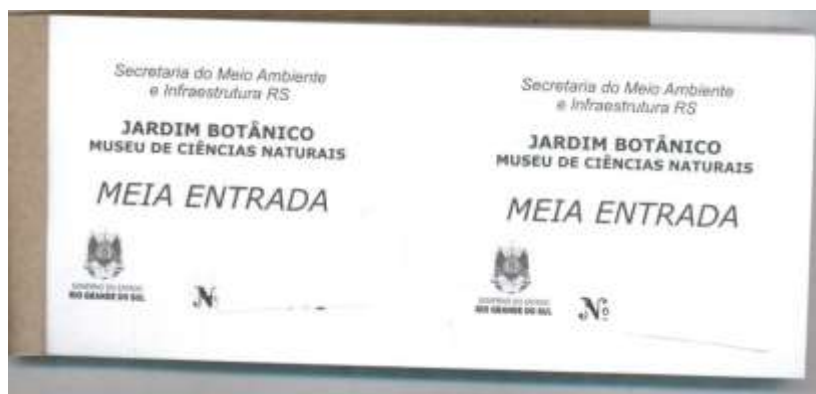
BLOCO MEIO INGRESSO COR BRANCO