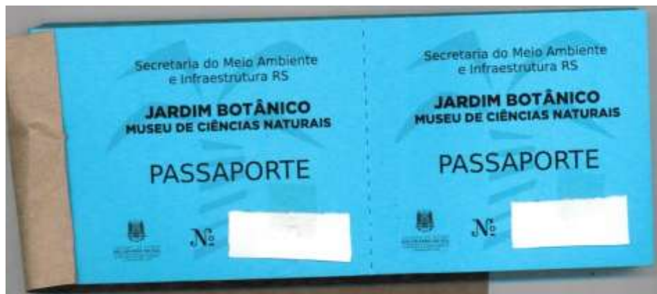
BLOCO INGRESSO PASSAPORTE FRENTE