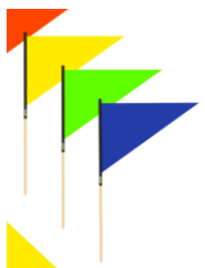
FOTO 3(02 BANDEIROLAS)