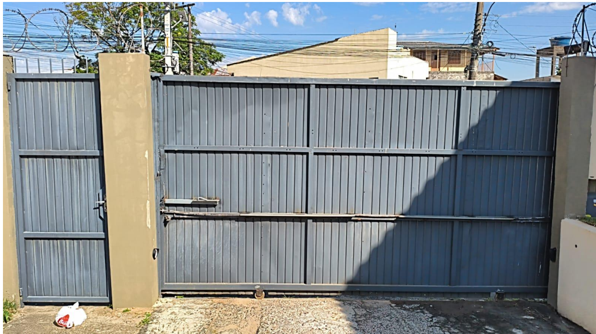
Imagem de Referência: (a parte gráfica não se encontra inclusa neste Termo)