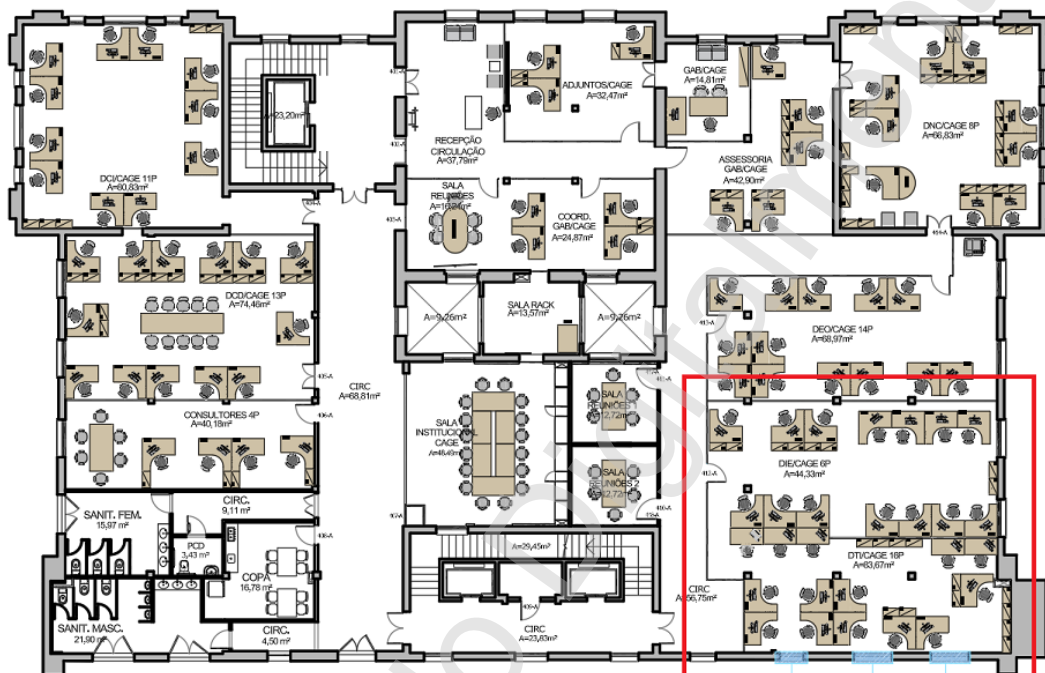
4º pav - Mauá