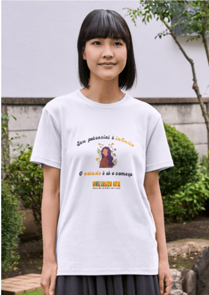
Figura 4: Mockup da camiseta