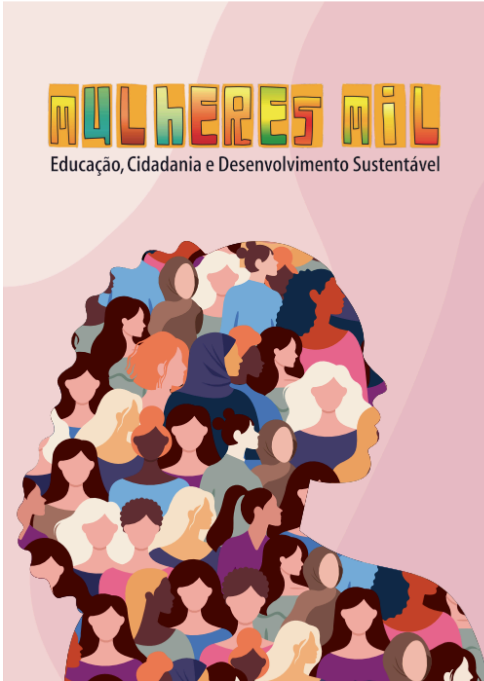
Figura 2: Contracapa do caderno