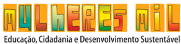
Figura 5: arte da ecobag