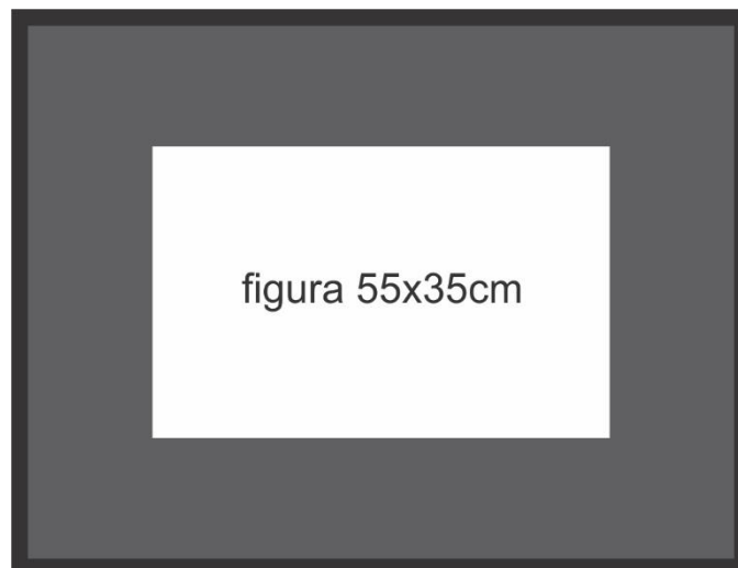
Figura 01: Dimensões das Molduras