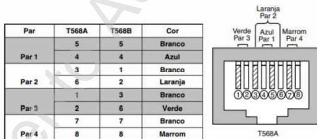
Figura 1- Configuração de terminação dos cabos junto às TT e Patch Panel

Os cabos UTP devem ser conectados junto às TT e patch panel de acordo com a configuração do tipo T568A, que está representada na Figura 1 abaixo.