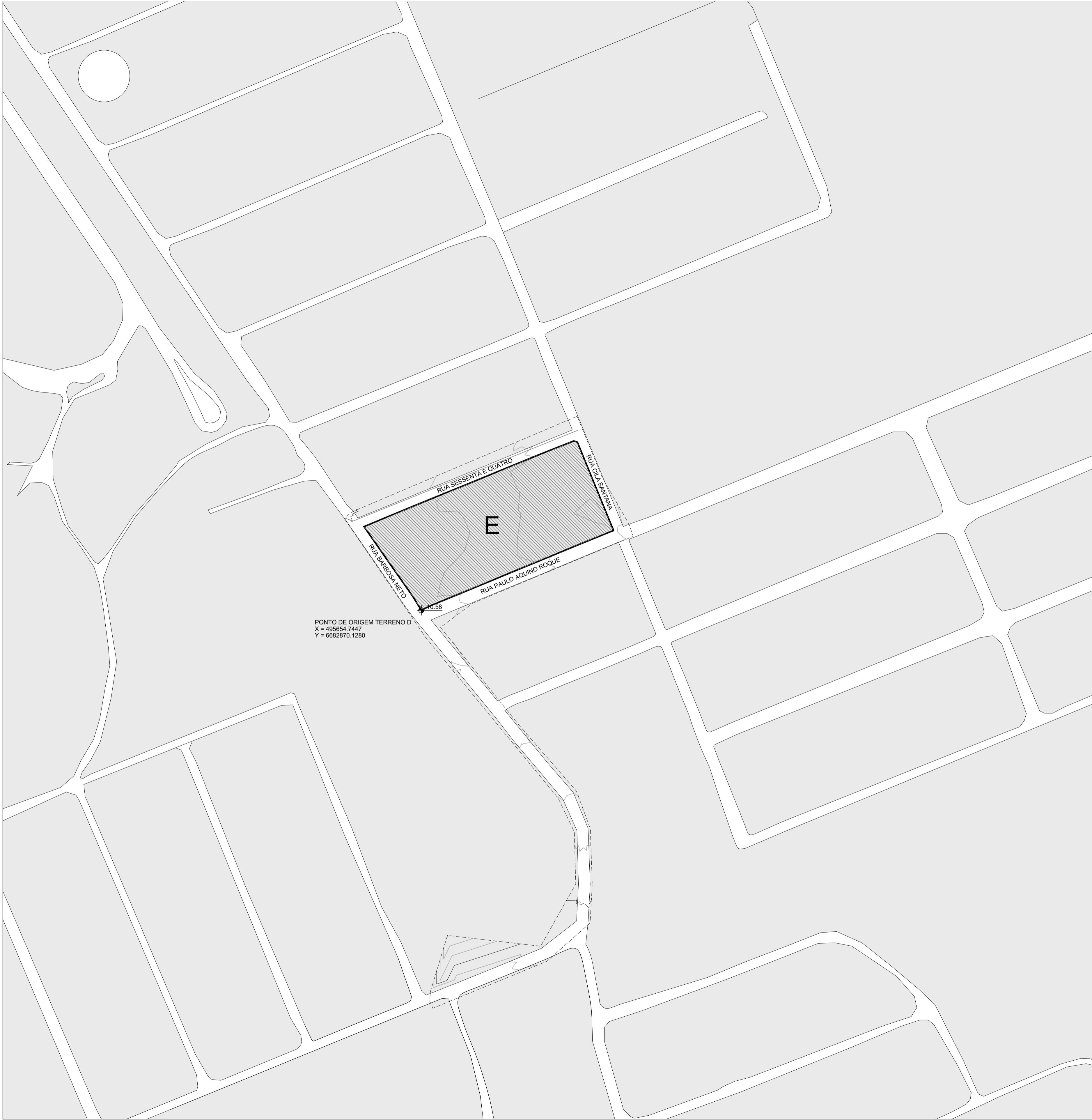
TERRENO E PLANTA DE SITUAÇÃO ESCALA 1:1500