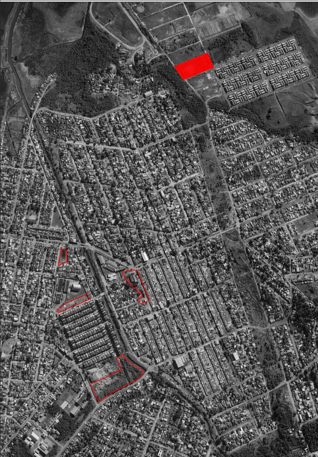
MAPA CHAVE - TERRENO E ESCALA 1:8000