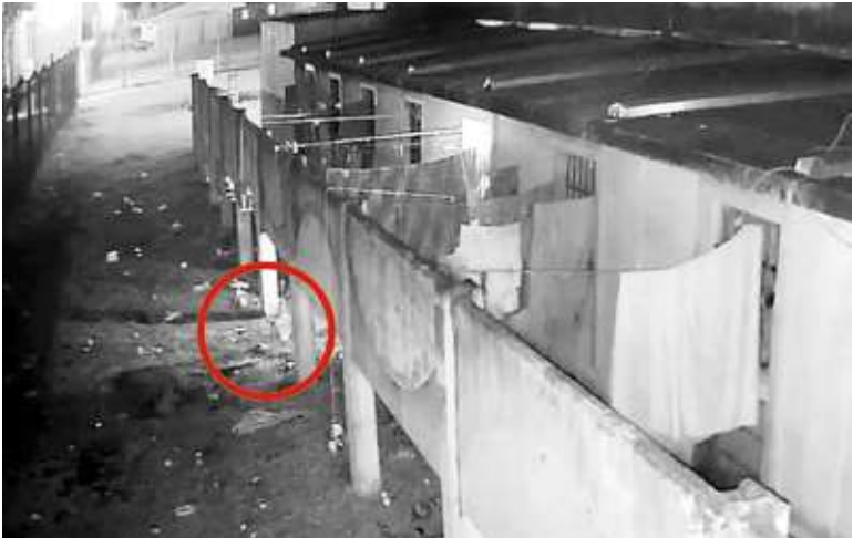
Imagem (no círculo) mostra o drone com alguém pegando o objeto

Câmeras de segurança da Pecan 3 registraram o aparelho transportando a pistola