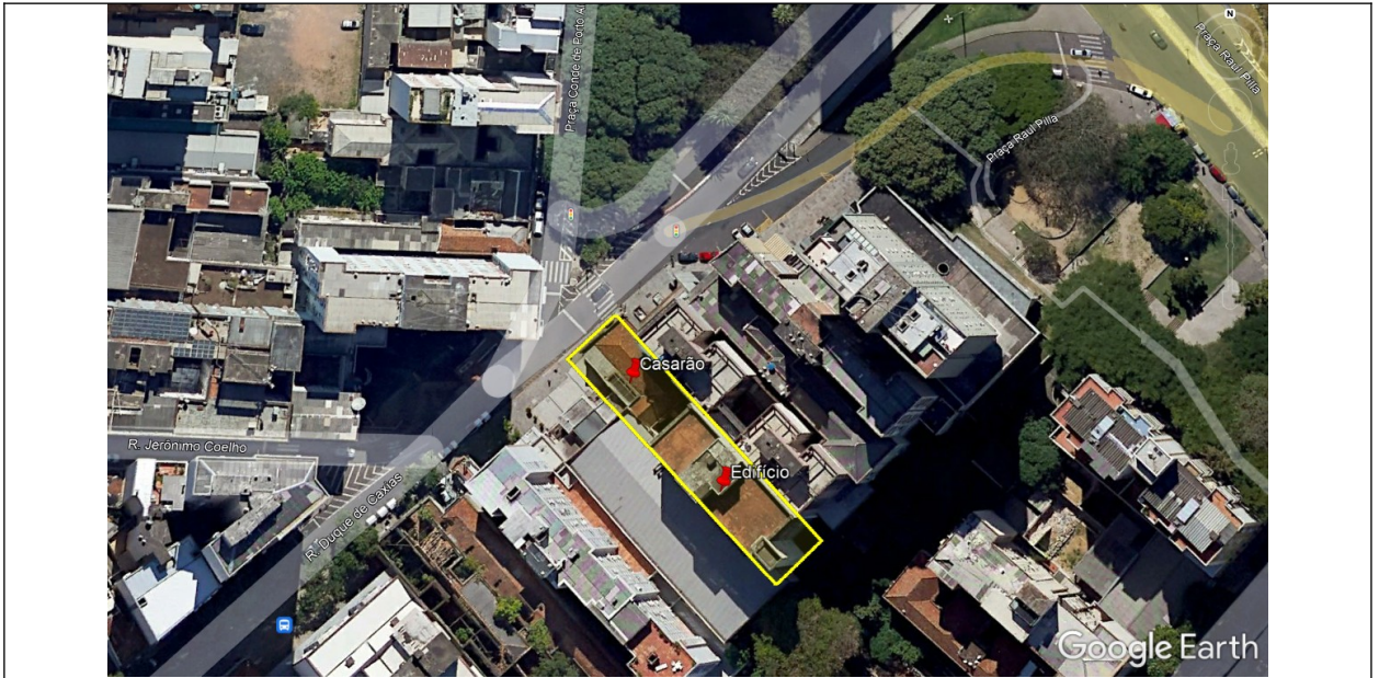
Imagem 1 – Vista geral da edificação e seu entorno.