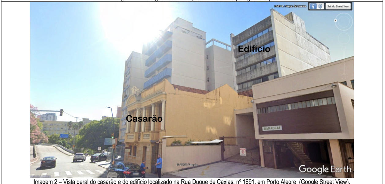
Imagem 2 – Vista geral do casarão e do edifício localizado na Rua Duque de Caxias, nº 1691, em Porto Alegre. (Google Street View).

O casarão tombado foi construído em 1916 e é a edificação que fica junto à calçada. Possui estrutura em alvenaria com 2 pisos, sendo cada piso com aproximadamente 140 m 2 de área útil, totalizando 280 m 2 de área útil total no casarão. Não há elevadores e cada andar possui 2 cabines sanitárias.