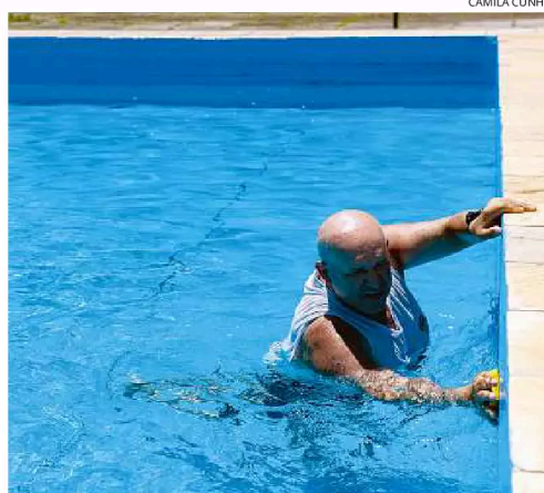
Piscinas já estão preparadas para a temporada de verão 2026