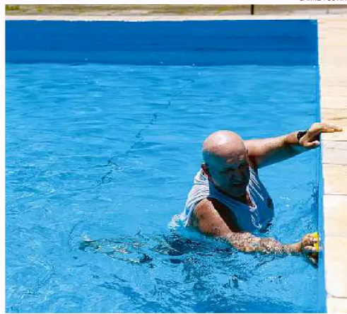
Piscinas já estão preparadas para a temporada de verão 2026