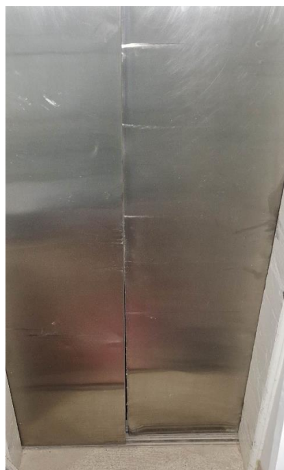
Imagem 05 – Porta de pavimento no terceiro andar danificada e sem segurança operacional.

Subsecretaria de Infraestrutura e Patrimônio Público Departamento de Projetos em Prédios Diversos