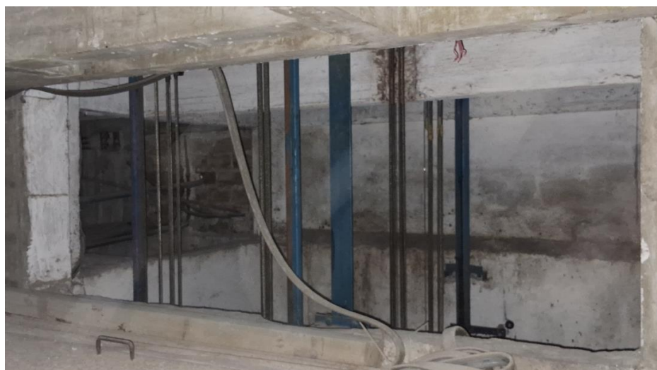
Imagem 07 – Caixa de corrida em péssimas condições e com risco de queda.