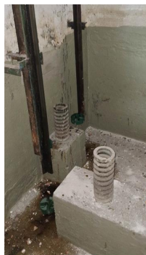
Imagem 21 – Poço do elevador n° 713