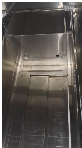
Imagem 18 – Cabina do elevador n° 711