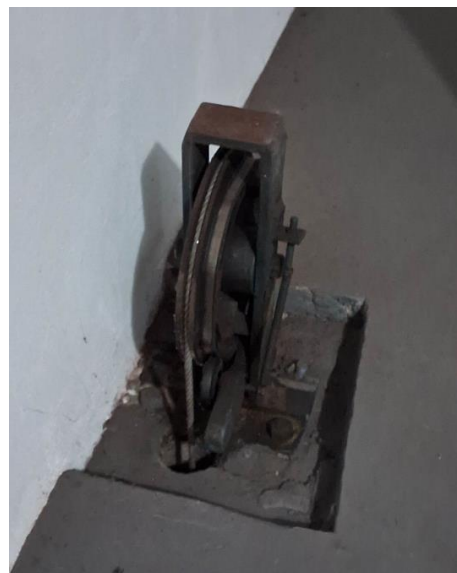
Imagem 09 – Regulador de velocidade obsoleto e sem proteção.