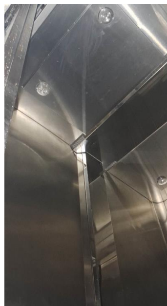
Imagem 19 – Cabina do elevador n° 711