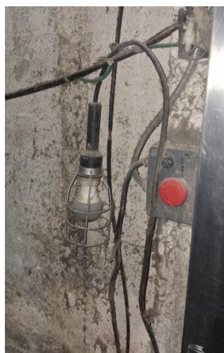
Imagem 20 – Iluminação e emergência do poço no elevador n° 713