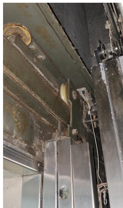
Imagem 06 – Operador de porta de pavimento em péssimas condições.