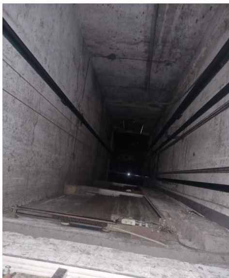
Imagem 08 – Caixa de corrida em péssimas condições e sem iluminação

Subsecretaria de Infraestrutura e Patrimônio Público Departamento de Projetos em Prédios Diversos