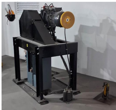
Imagem 10 – Sistema de tração do elevador n° 713 sem proteção