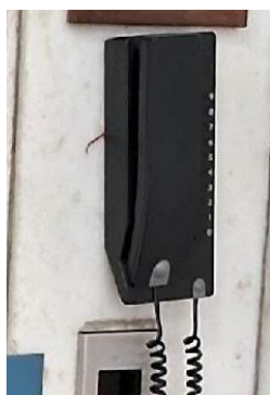
Imagem 14 – Interfone do elevador n° 713 danificado