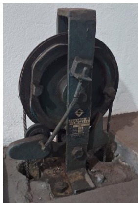
Imagem 12 – Regulador de velocidade do n° 711

Subsecretaria de Infraestrutura e Patrimônio Público Departamento de Projetos em Prédios Diversos