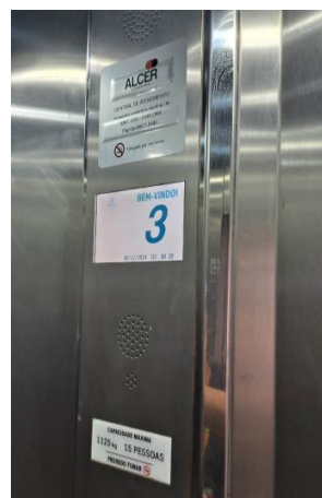
Imagem 17 – Cabina do elevador n° 713