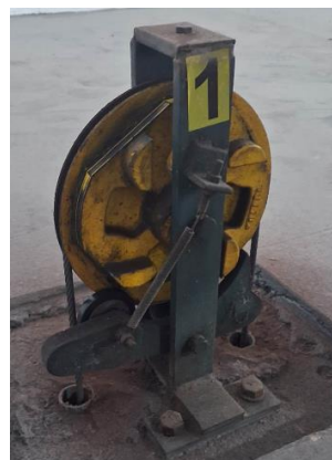
Imagem 13 – Regulador de velocidade do n° 713.