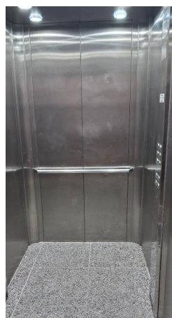
Imagem 16 – Cabina do elevador n° 713