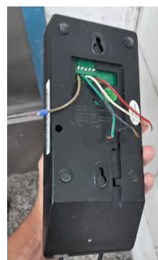
Imagem 15 – Interfone do elevador n° 713 danificado