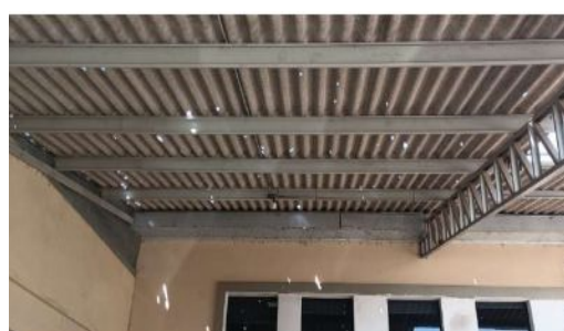
2. Sala de Instrução