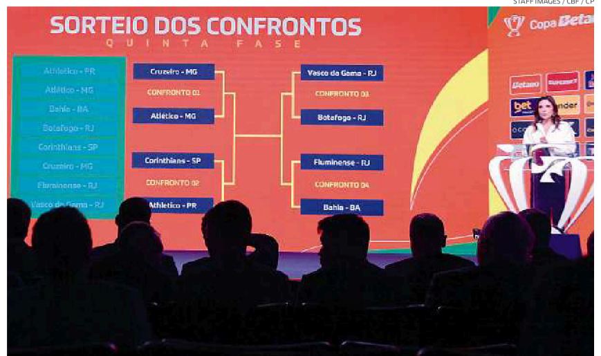
Confrontos de ida das quartas de final da Copa do Brasil serão realizados na última semana de agosto