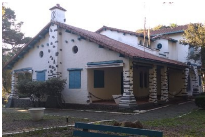
Anexo A. – Casa Branca

ESTADO DO RIO GRANDE DO SUL SECRETARIA DA CASA CIVIL SUBCHEFIA ADMINISTRATIVA