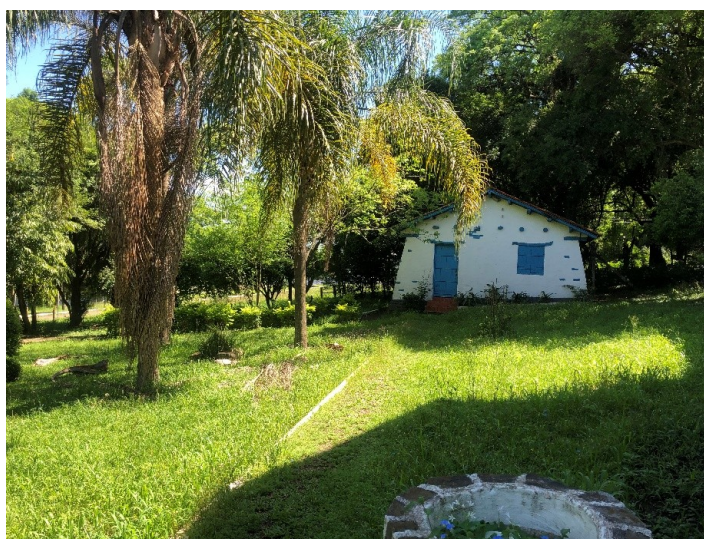
Anexo A. – Casa de Apoio