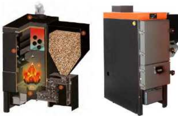
Figura do modelo de caldeira com o funil de abastecimento do material pellets. Medidas do conjunto caldeira e funil: