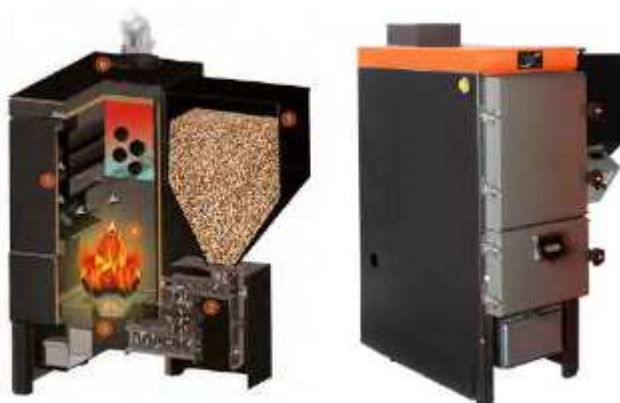
Figura do modelo de caldeira com o funil de abastecimento do material pellets. Medidas do conjunto caldeira e funil: