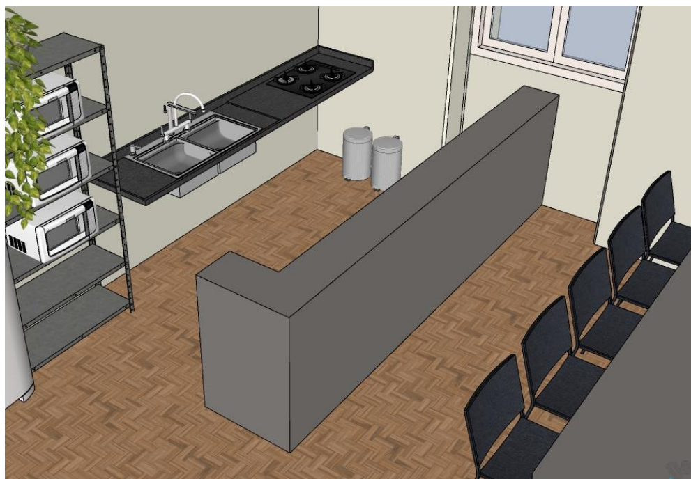
FIGURA 3 – Balcão existente sobre o qual o tampo de granito deverá ser assentado