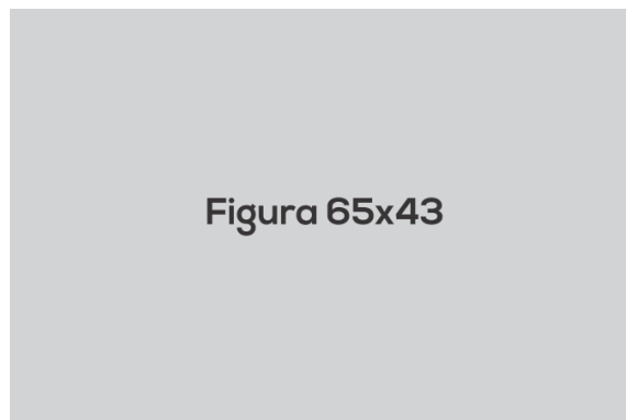
Ilustração da composição