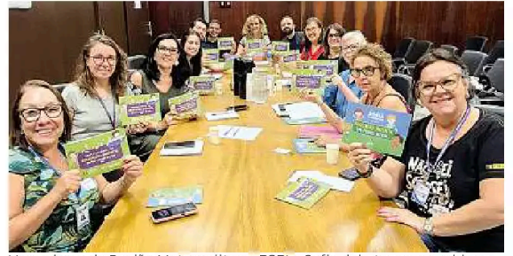
Vereadores de Região Metropolitana, FGEI e Sofia debateram o problema