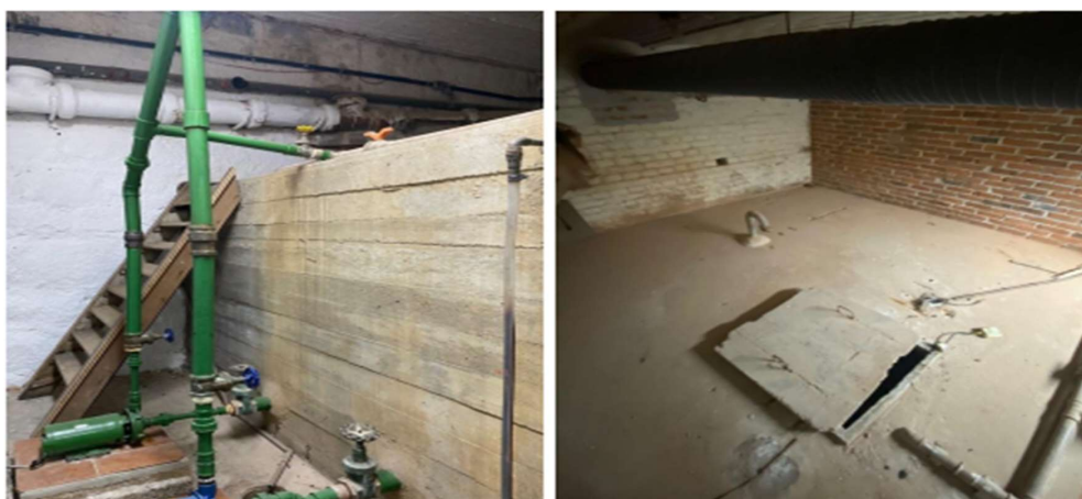
Anexo A. – reservatório de água subsolo Ala Governamental do Palácio Piratini

8.1. A Contratada deverá fornecer uma garantia mínima de execução de 6 (seis) meses a contar da entrega do serviço ao Contratante.