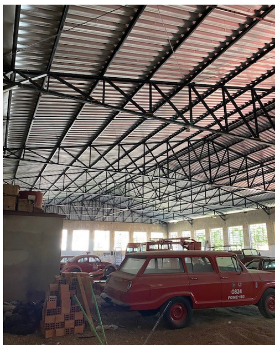
Figura 02 – cobertura do atual prédio garagem