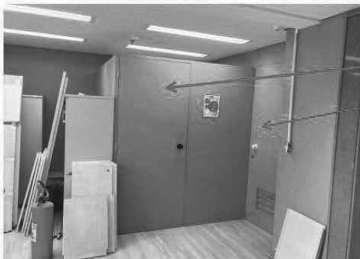
Divisória 02: a ser substituída