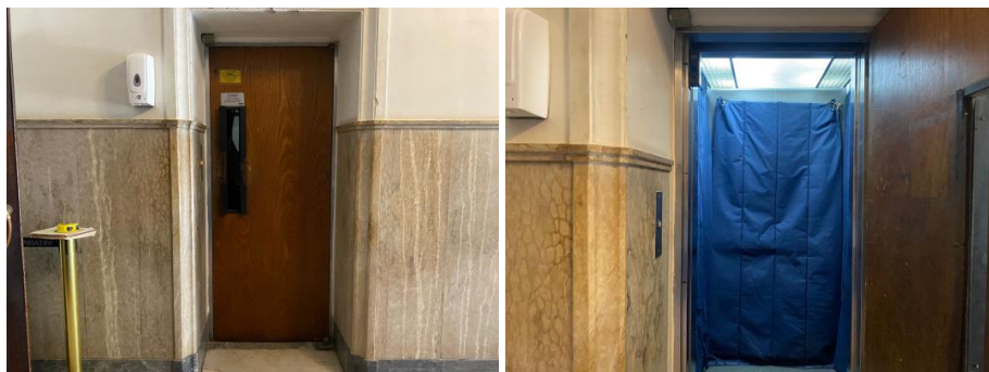
Imagem do Elevador