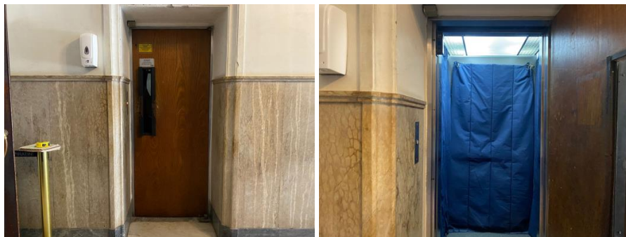
Imagem do Elevador Principal Ala Governamental