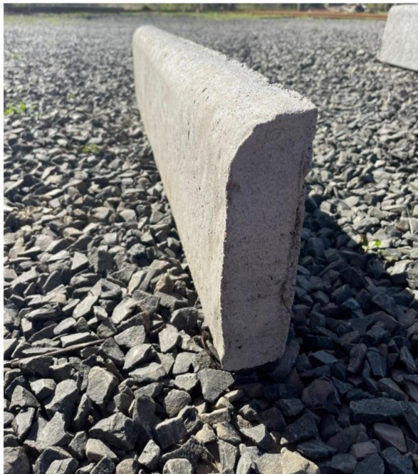
MEIO-FIO EM CONCRETO