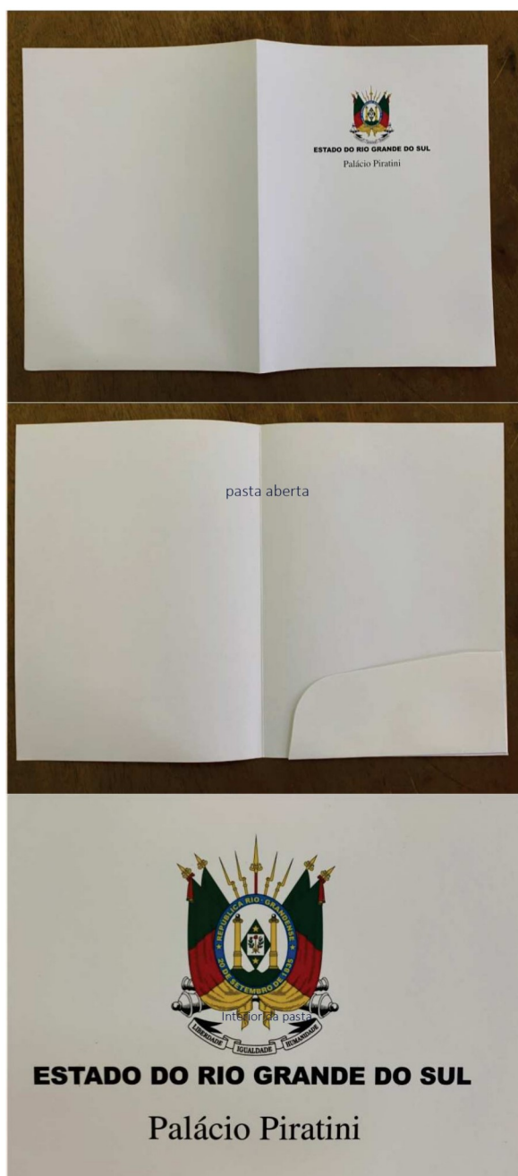
Arte da pasta