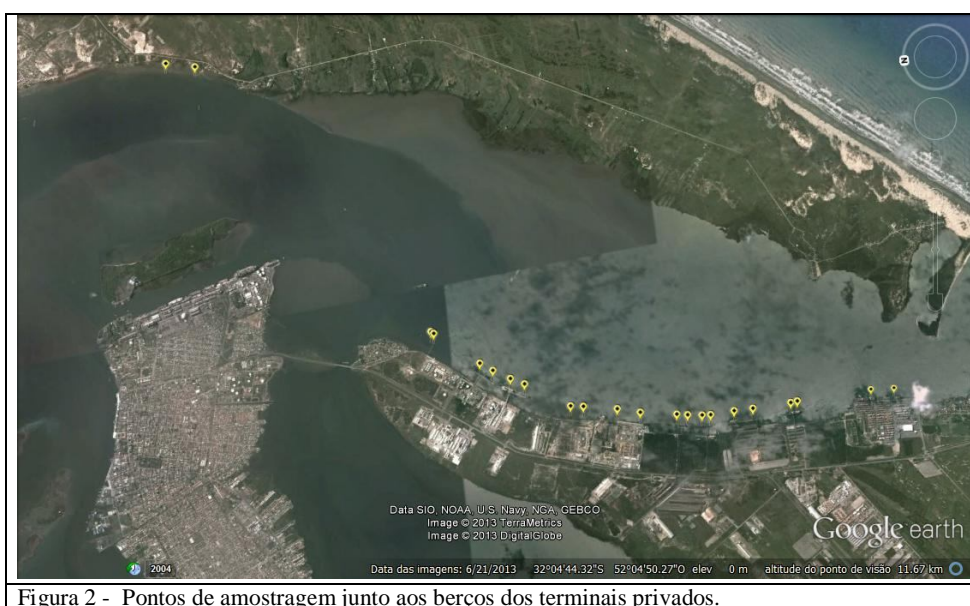
Figura 2 - Pontos de amostragem junto aos berços dos terminais privados.

Ainda, segundo o Parecer nº007077/2013 COPAH/IBAMA fixamos dois pontos de coletas nos berços de atracação dos terminais privados (Figura 2) na área do Porto Organizado do Rio Grande, totalizando 22 pontos amostrais, a saber: BRASKEM; TRANSPETRO; YARA BRASIL; ERG 2; ERG1; BUNGE; BIANCHINI; TERMASA; TERGRASA; TECON/RS; EBR (na face leste do canal, no Município de São José do Norte).